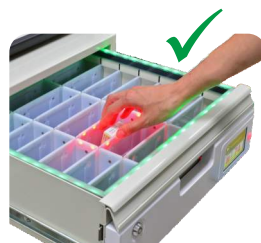
取藥位置正確 外框亮綠燈