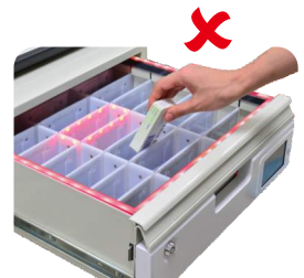
取藥位置錯誤 外框亮紅燈