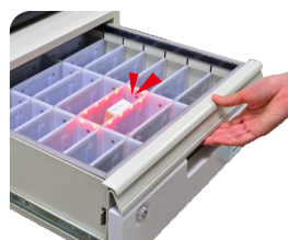
亮燈提示 藥物位置